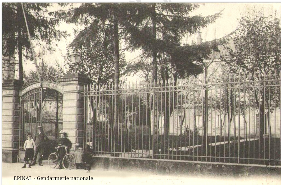
EPINAL - Gendarmerie nationale